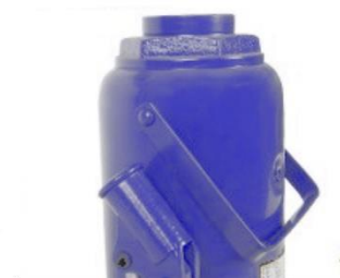
empuñadura de mango pesado