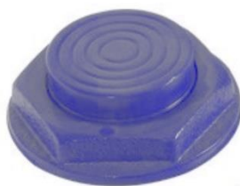
Extensión con tratamiento térmico