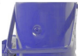
conector de aceite patentado