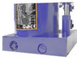
válvula de seguridad, amplia base pesada